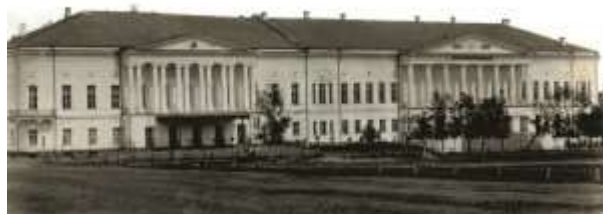
Гимназия, город Владимир